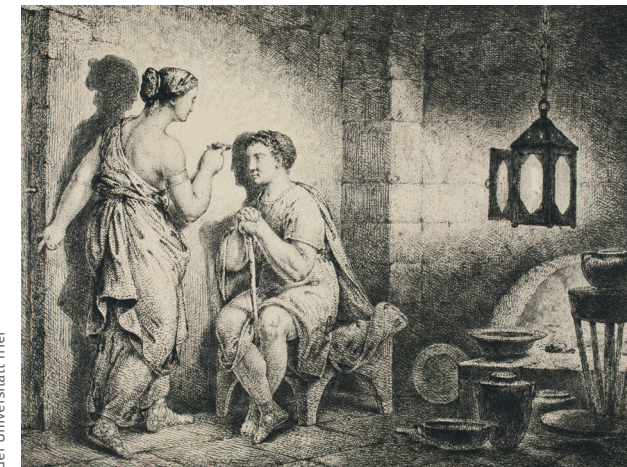
Christian Bernhard Rode: Die Kindheit der Malerkunst (Die Erfindung der Zeichenkunst), 1790, Graphische Sammlung der Universität Trier