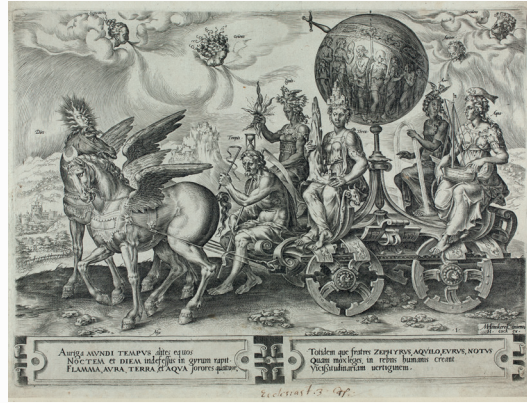
Cornelius Cort nach Maarten van Heemskerck: Der Kreislauf des menschlichen Daseins (Blatt 1 aus der Serie Der Kreislauf des menschlichen Daseins), 1564, Graphische Sammlung der Universität Trier