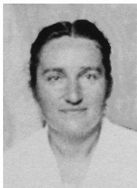
Abb. 2: Ausschnitt, freigestellt.